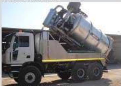
▲ HMM 6x4 asphalt mixer / mixer asphalt