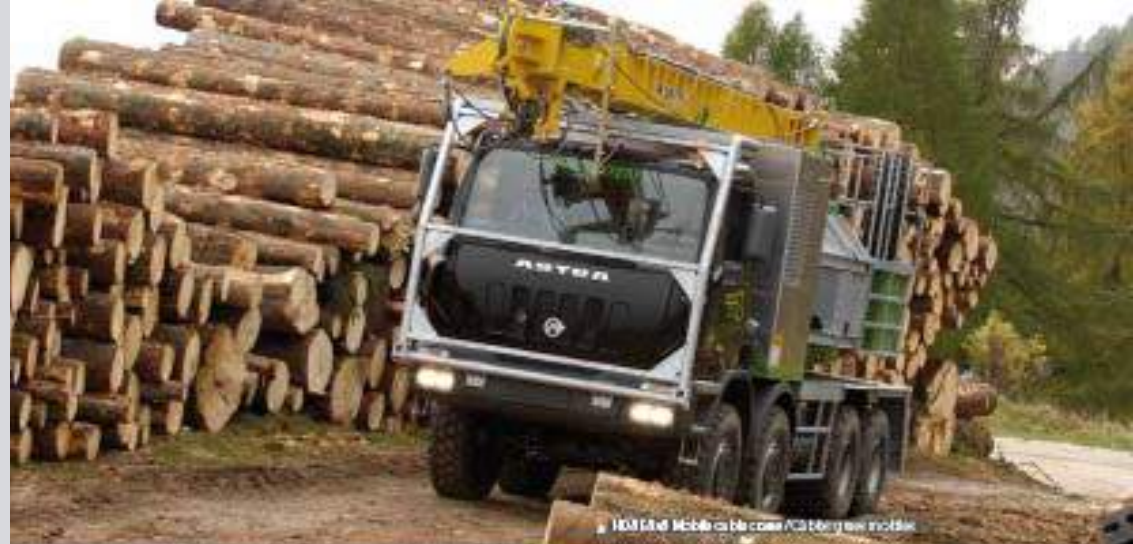
▲ HMM 6x4 Mobile crane / Cablogue mobile