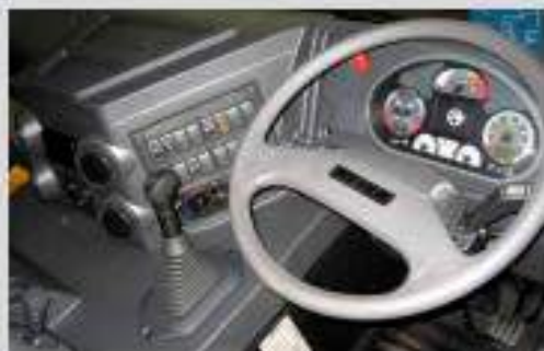
HD8 HD8, right hand drive / HD8 HD8, right hand drive