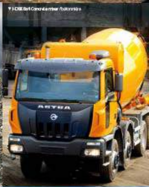
▲ HMM 6x4 Concrete mixer / bétonnière