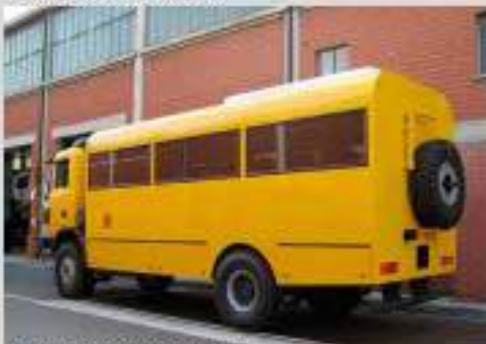
▲ HMM 6x4 O-road bus / bus tout terrain