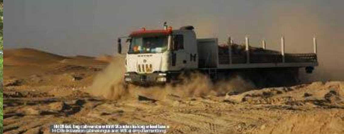
HD8 HD8, big cab version with 10.7L Euro 3 engine and 12000kg GVW HD8 HD8, big cab version with 10.7L Euro 3 engine and 12000kg GVW

HD8 HD8 Heavy Duty truck with 10.7L Euro 3 engine and 12000kg GVW HD8 HD8 Heavy Duty truck with 10.7L Euro 3 engine and 12000kg GVW HD8 HD8 Heavy Duty truck with 10.7L Euro 3 engine and 12000kg GVW