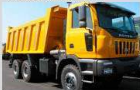
HD8 HD8, right hand drive / HD8 HD8, right hand drive