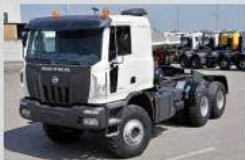
HD8 HD8, truck version with 10.7L Euro 3 engine and 12000kg GVW