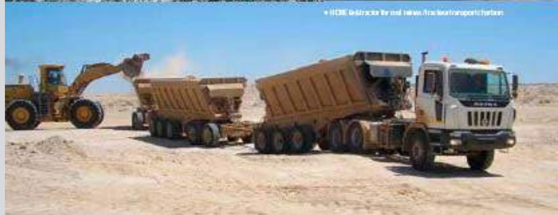
▲ HMM 6x4 truck for road works / camion transport / chantier