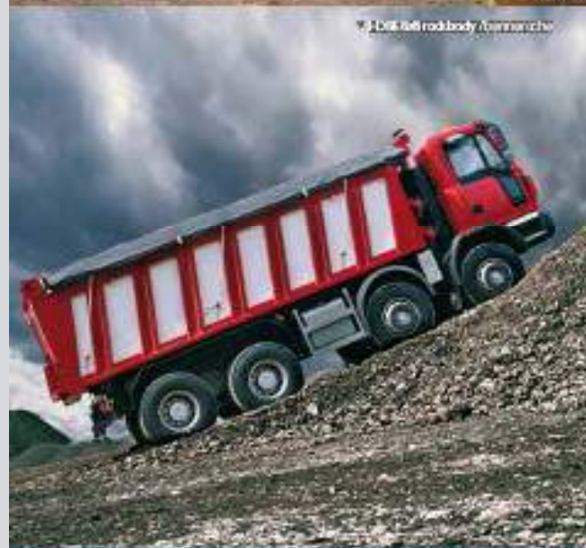
▲ HMM 6x4 rockbody / benne roche