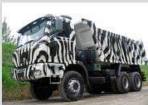
▲ HMM 6x4 rockbody / benne roche

Le système électronique du véhicule permet la paramétrisation des prises de mouvement en fonction des nécessités des équipementiers.